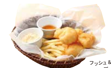
フッシュ & チップス