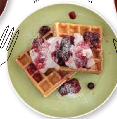
焼きたてワッフルマルベリー MULBERRY WAFFLE