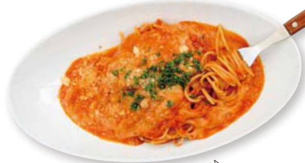
MOZZARELLA AND TOMATO PASTA モッツアレラと トマトソーススパゲッティーニ