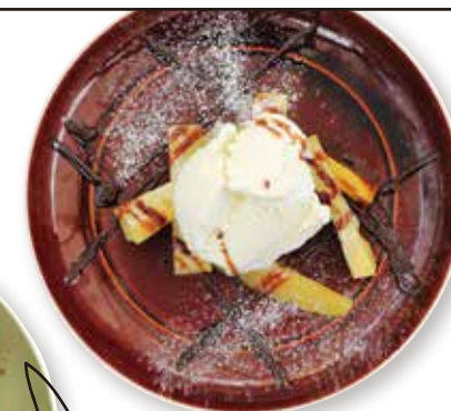
BENIHARUKA (SWEET POTATO) WITH VANILLA ICE CREAM 熱々の紅はるかとはニラアイス