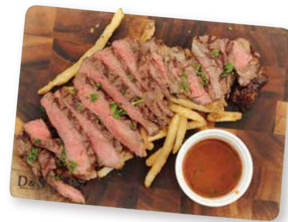
US BEEF RIB EYE ROAST US牛リブアイロース