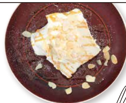
VANILLA CARAMEL ANGEL FOOD CAKE エンゼルフードバニラキャラメル