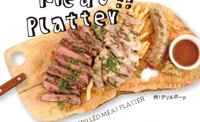
LOADS OF MEAT! GRILLED MEAT PLATTER 肉! グリルボード