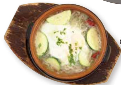
To day's Ajillo アヒージョ