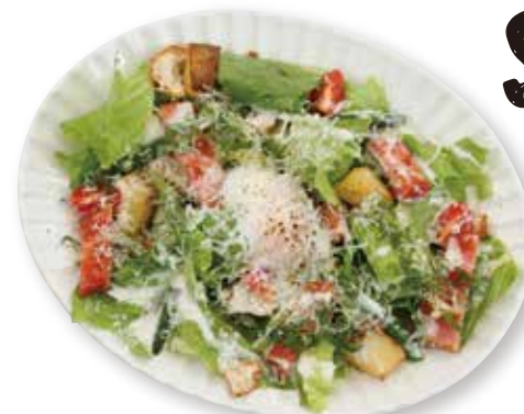
半熟卵のシーザーサラダ