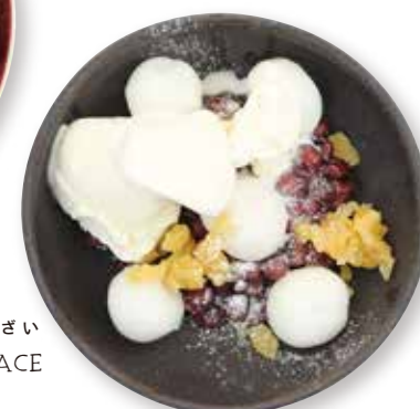
両国テラスクリームぜんざい RYOGOKU TERRACE ZENZAI SWEET RED BEAN SOUP WITH MOCHI & VANILLA ICE CREAM