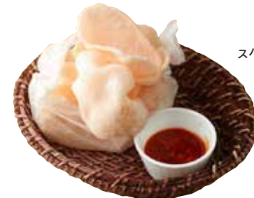
スパイシーエビセン